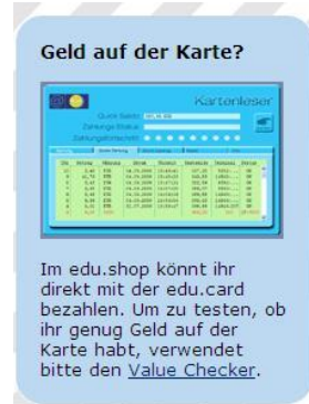
Abbildung 9: Quick ValueChecker

Auf der Startseite des edu.shop befindet sich ein Link zum Aufruf des Value Checkers.