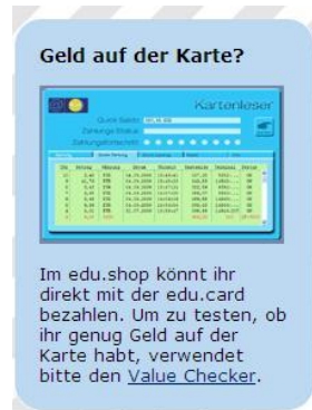
Abbildung 9: Quick ValueChecker

Auf der Startseite des edu.shop befindet sich ein Link zum Aufruf des Value Checkers.