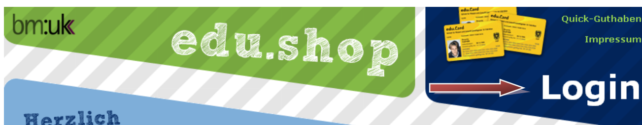
Abbildung 1: Login über Portalseite

Anschließend kommt man auf die Loginmaske. Je nach Schule können dort folgende Anmeldemethoden verfügbar sein: