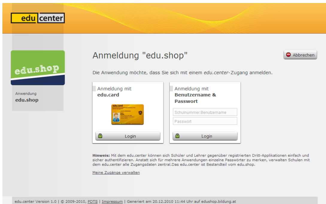
Abbildung 2: Loginmaske