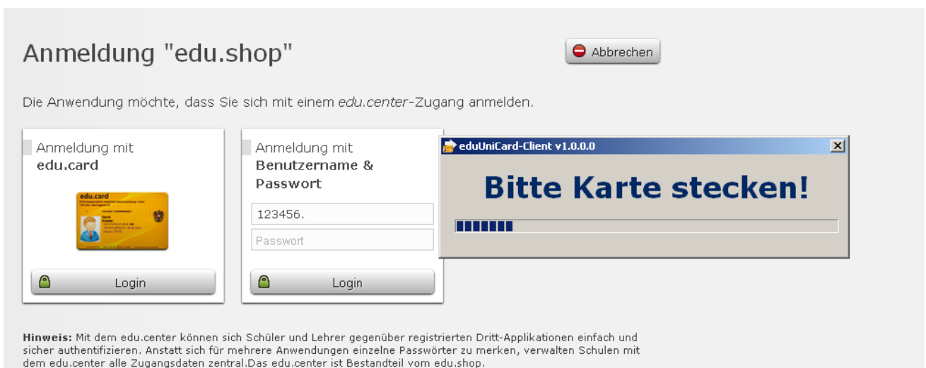
Abbildung 3: Startseite mit edu.card Login

Nach dem Klick auf Login muss die edu.card in den Chipkartenleser gesteckt werden. Die Kartendaten werden gelesen und der Benutzer am edu.shop angemeldet. Ein erfolgreiches Login führt zur edu.shop Übersichtsseite.