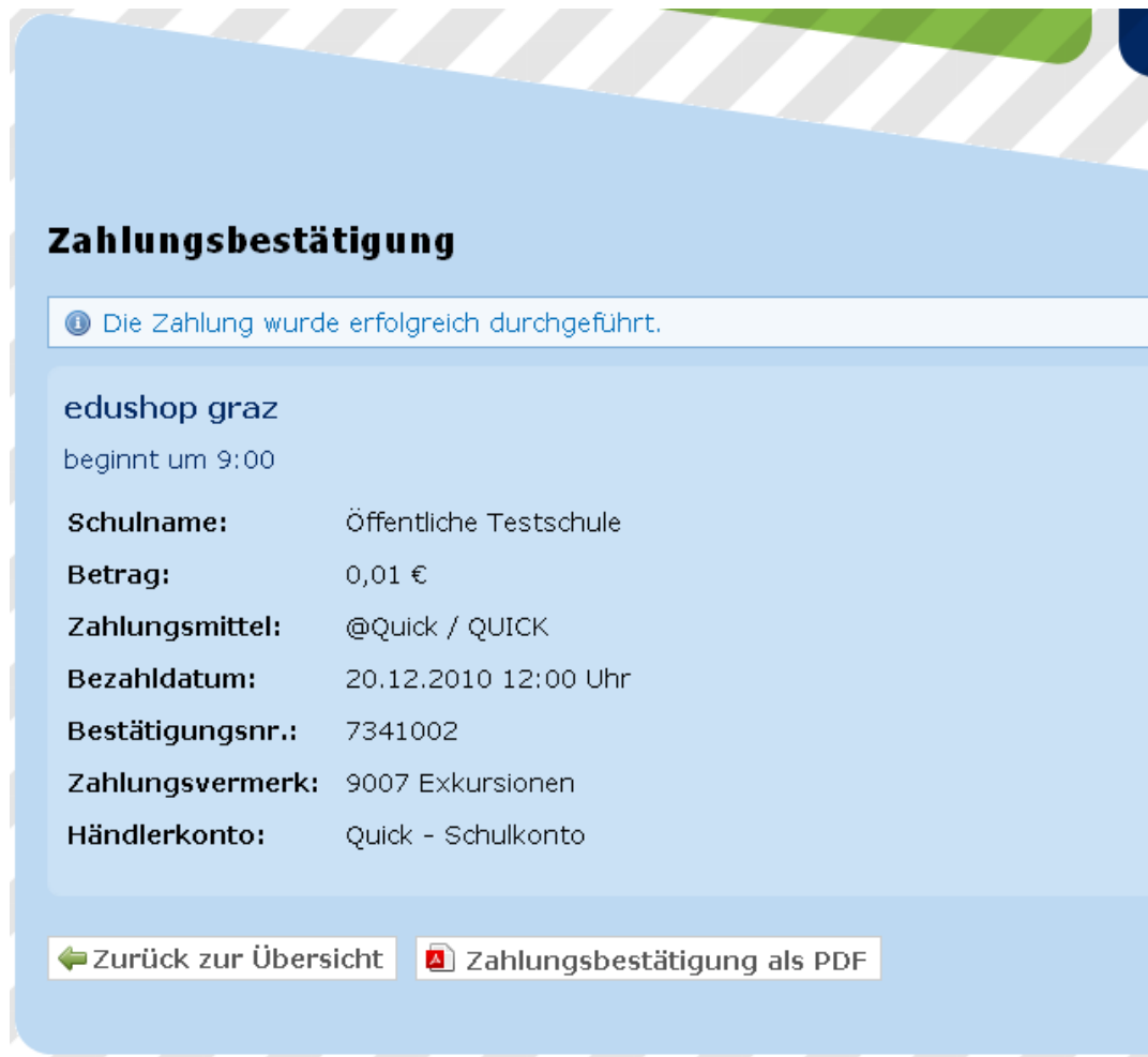
Abbildung 8: Zahlungsbestätigung

Auf dieser Bestätigungsseite findet man folgende Informationen: