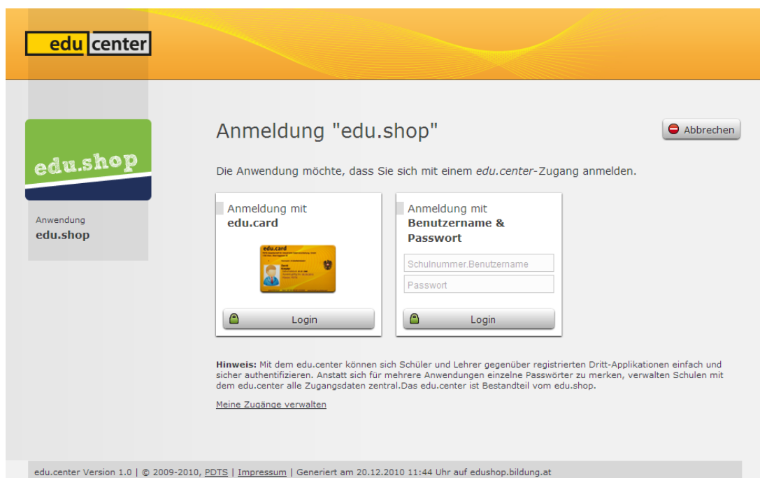
Abbildung 2: Loginmaske