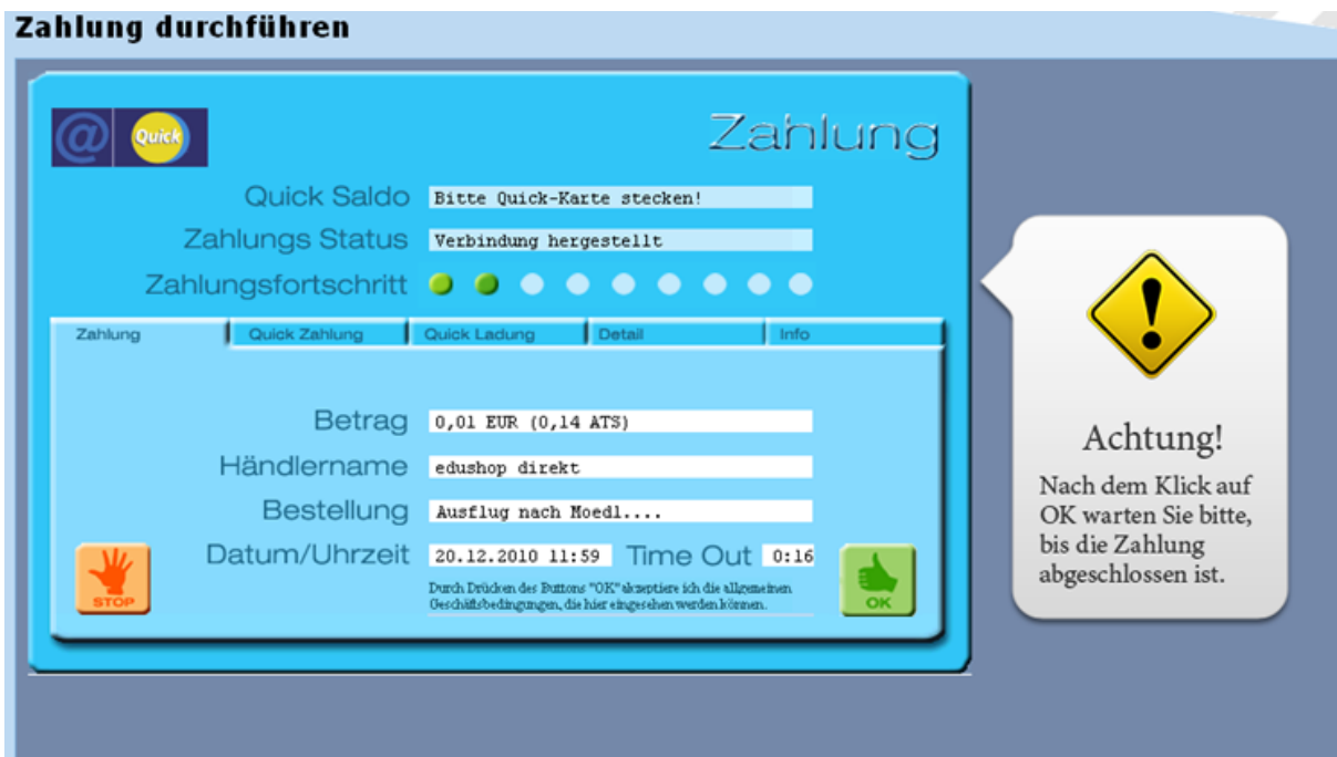
Abbildung 7: @Quick Plugin

Über die Schaltfläche „Zahlung durchführen“ wird der Bezahlvorgang gestartet. Anschließend öffnet sich ein Fenster mit dem so genannten @Quick-Plugin. Dieses Fenster sieht folgendermaßen aus: