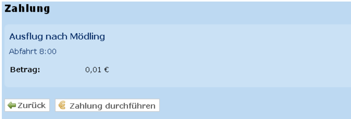
Abbildung 6: Detailansicht einer offenen Zahlung

Bevor der Bezahlprozess gestartet wird, wird der zu zahlende Eintrag detailliert angezeigt.